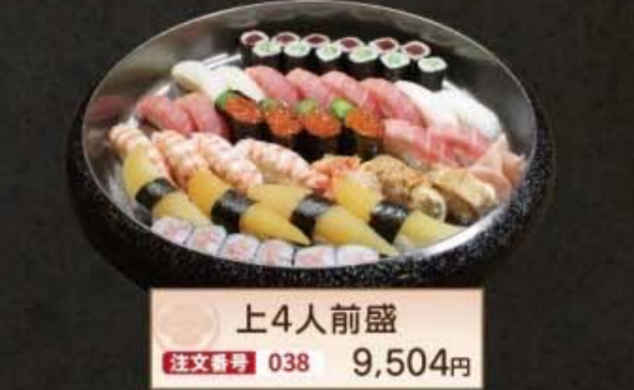
上4人前盛 注文番号 038 9,504円