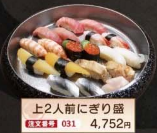
上2人前にぎり盛 注文番号 031 4,752円