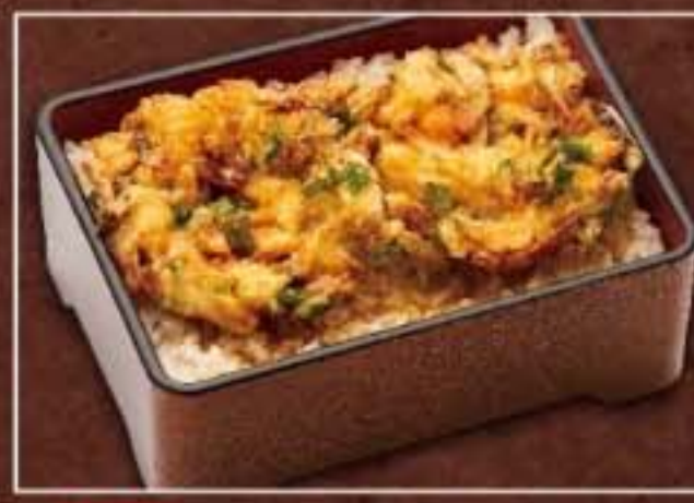
052 かき揚げ丼 864円