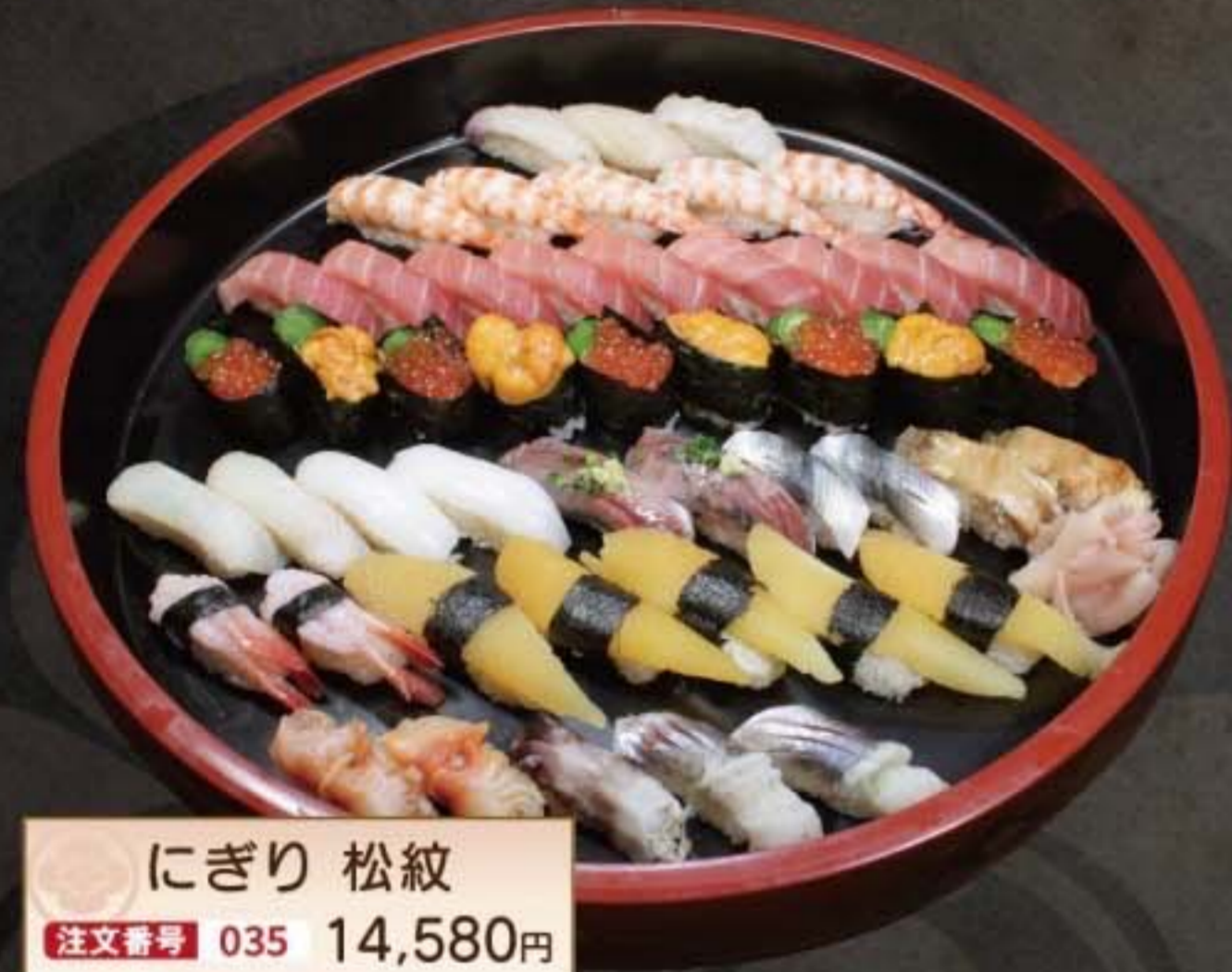
にぎり 松紋 注文番号 035 14,580円