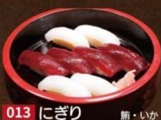
013 にぎり 鮪・いか 2,160円