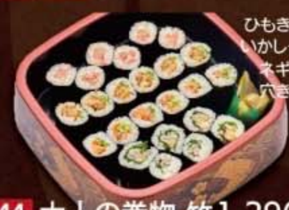
044 大人の巻物 竹 1,296円