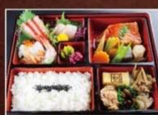
065 白鷺御膳 2,700円