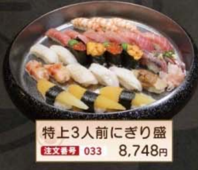
特上3人前にぎり盛 注文番号 033 8,748円