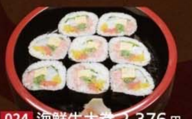
024 海鮮生太巻 2,376円