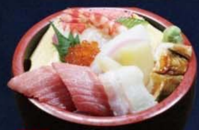
009 上ちらし 2,376円