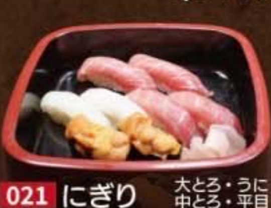
021 にぎり 大とろ・うに 中とろ・平目 5,184円