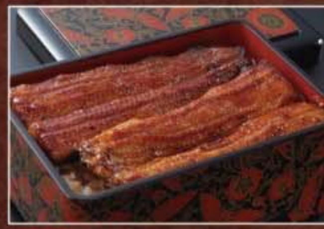
050 うな重 3,780円