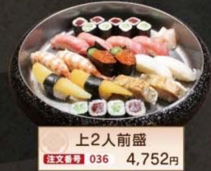
上2人前盛 注文番号 036 4,752円