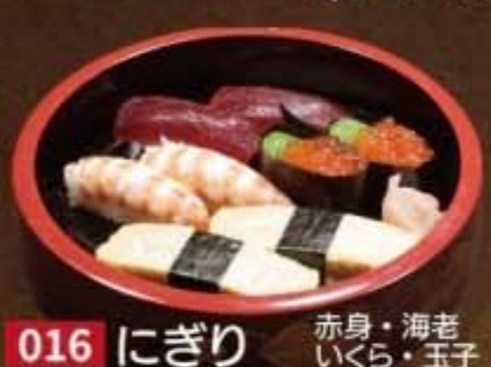
016 にぎり 赤身・海老 いくら・玉子 2,160円