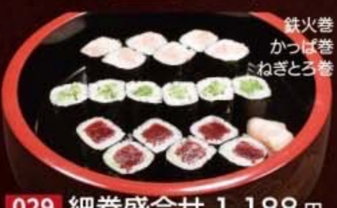
029 細巻盛合せ 1,188円