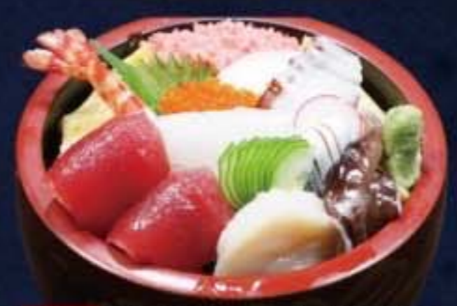
007 並ちらし 1,728円