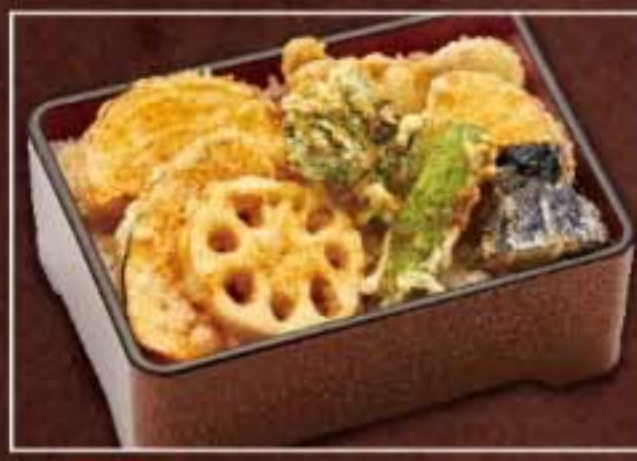
053 野菜天丼 972円