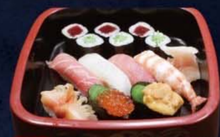
005 特上にぎり 3,780円