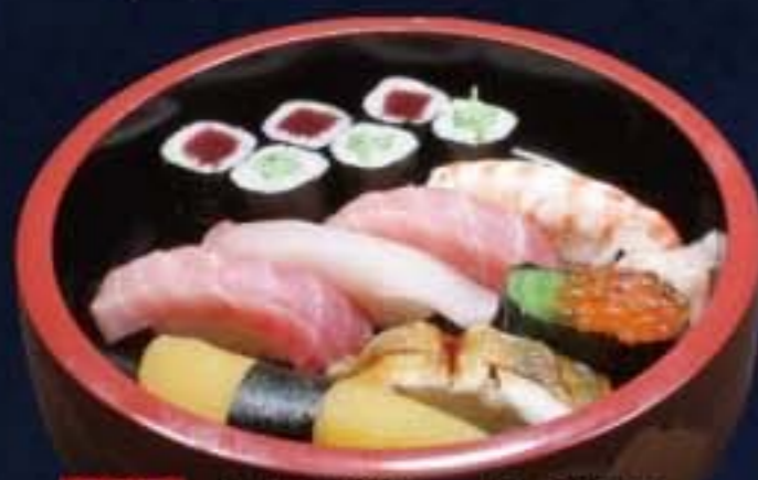
003 上にぎり 2,376円