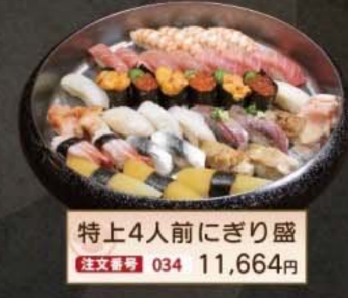
特上4人前にぎり盛 注文番号 034 11,664円