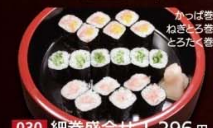
030 細巻盛合せ 1,296円