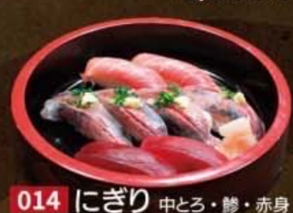
014 にぎり 中とろ・鮪・赤身 3,024円