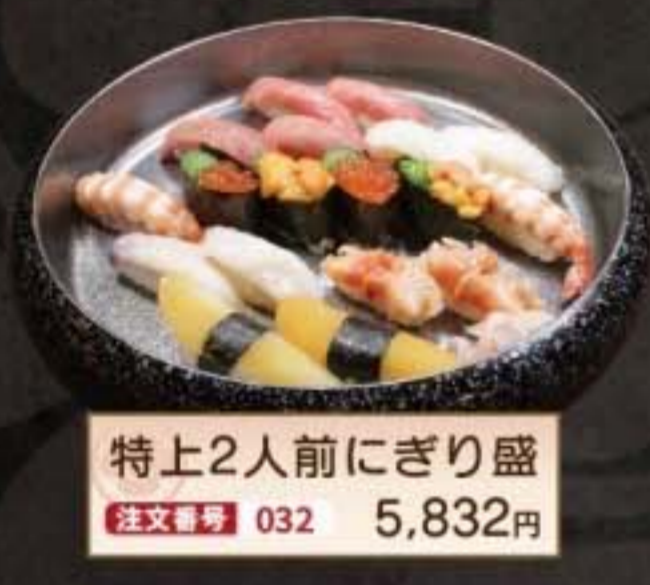
特上2人前にぎり盛 注文番号 032 5,832円