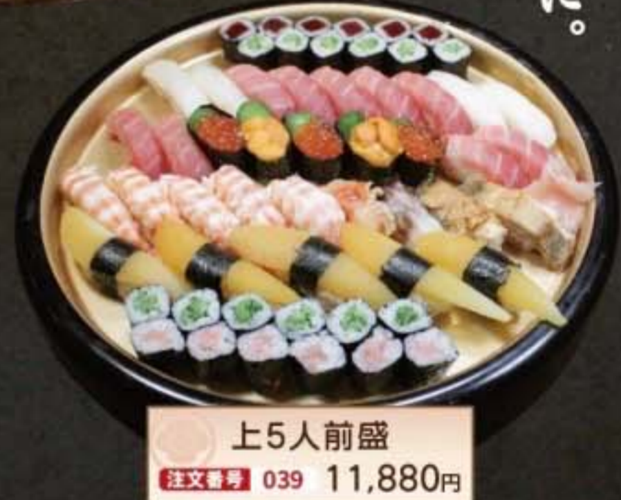
上5人前盛 注文番号 039 11,880円