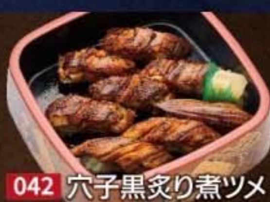
042 穴子黒炙り煮ツメ 2,160円