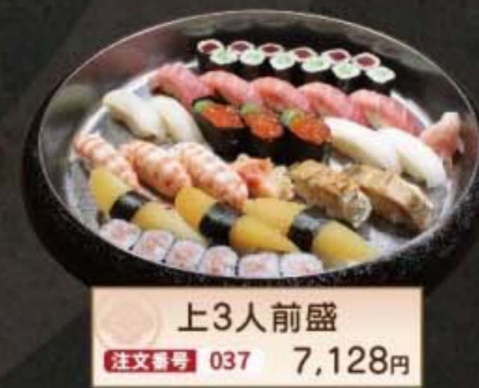
上3人前盛 注文番号 037 7,128円