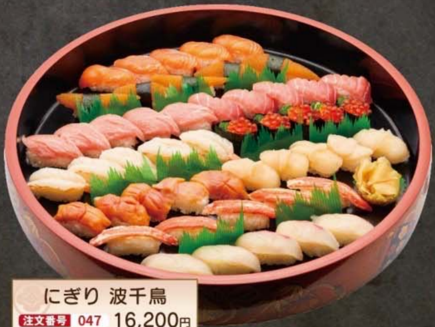
にぎり 波千鳥 注文番号 047 16,200円