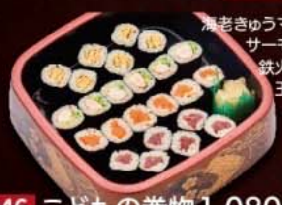
046 こどもの巻物 1,080円