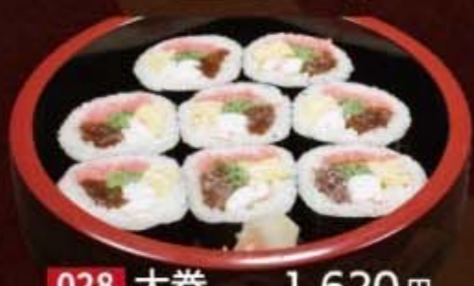
028 太巻 1,620円