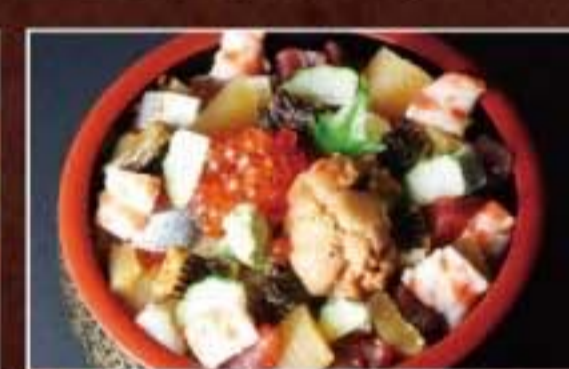
063 海鮮ばら丼 1,944円