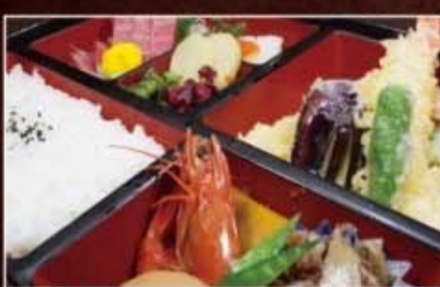
062 剣御膳 2,700円