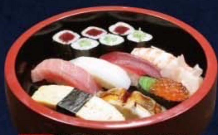
002 中にぎり 2,160円