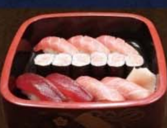
020 鮪づくし 3,780円