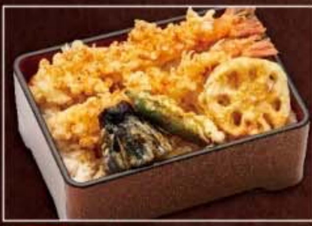
054 海老天丼 1,620円