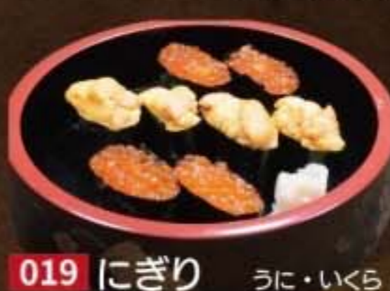
019 にぎり うに・いくら 4,860円