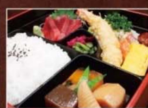
064 幕の内膳 864円