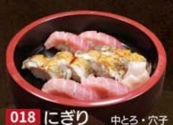
018 にぎり 中とろ・穴子 3,456円