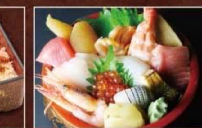
059 海鮮丼 3,780円