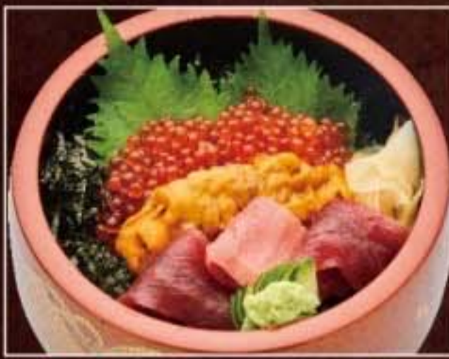
058 ウニいくら鉄火丼 4,860円