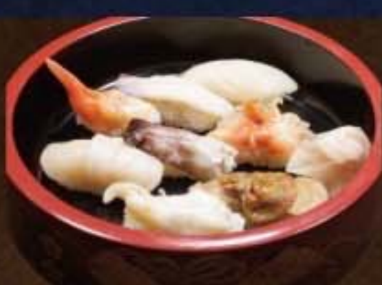
017 貝づくし 2,376円