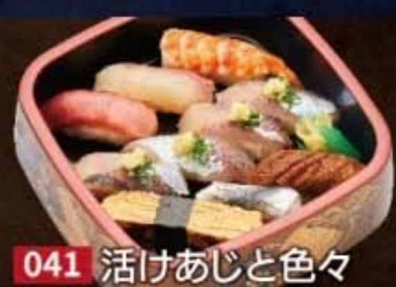
041 活けあじと色々 2,376円