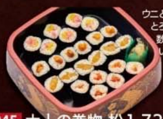
045 大人の巻物 松 1,728円