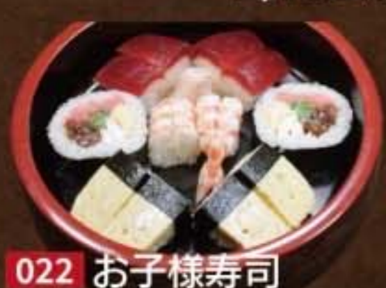
022 お子様寿司 1,620円