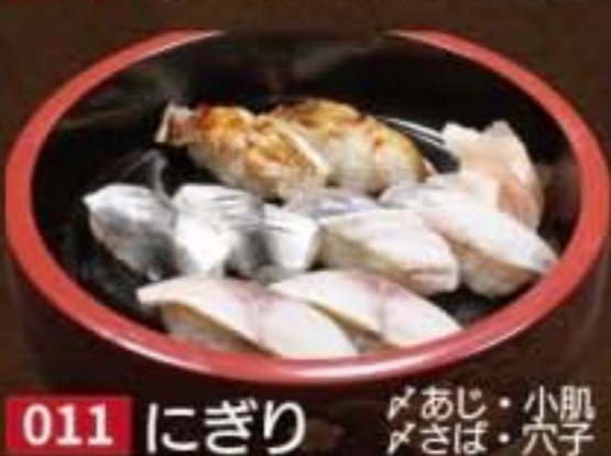
011 にぎり 鮪あじ・小肌 鮪あじ・小肌 1,944円