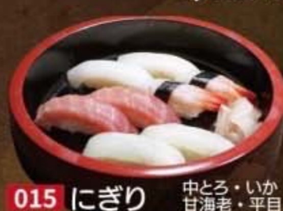
015 にぎり 中とろ・いか 甘海老・平目 2,376円