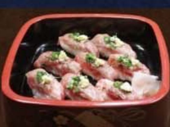
023 和牛炙り 2,376円