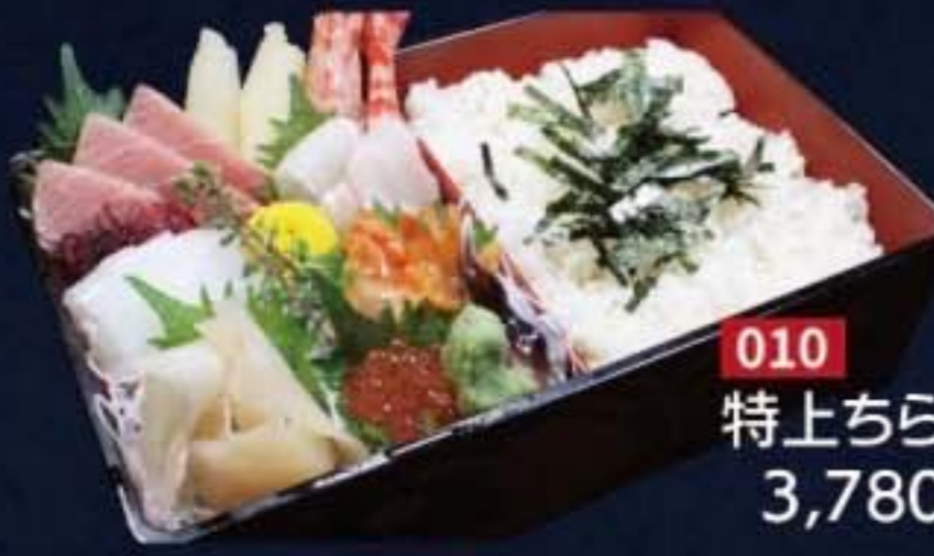
010 特上ちらし 3,780円