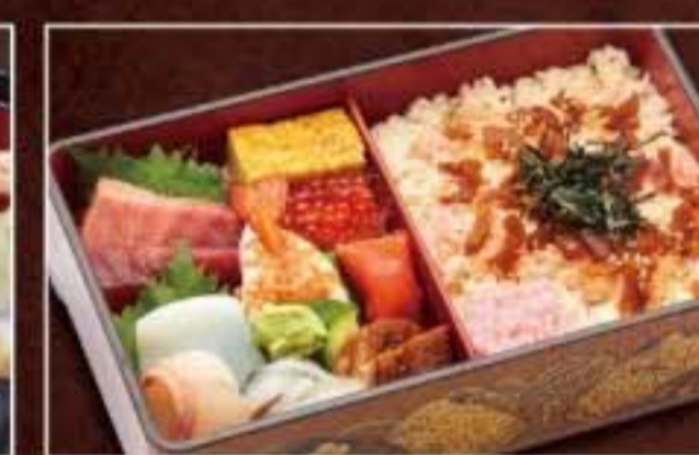
061 ちらし膳中 2,160円