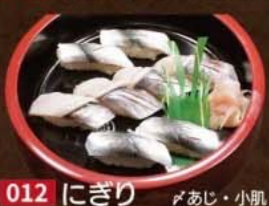
012 にぎり 鮪あじ・小肌 1,944円