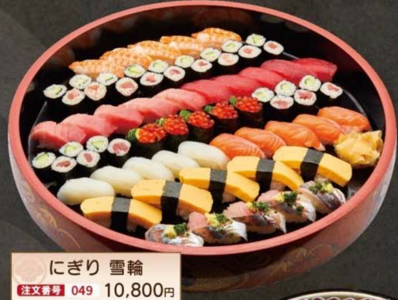
にぎり 雪輪 注文番号 049 10,800円