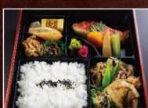
066 金目煮幕の内膳 1,944円