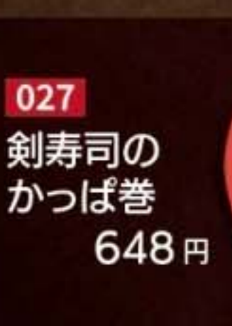
027 剣寿司の かつば巻 648円