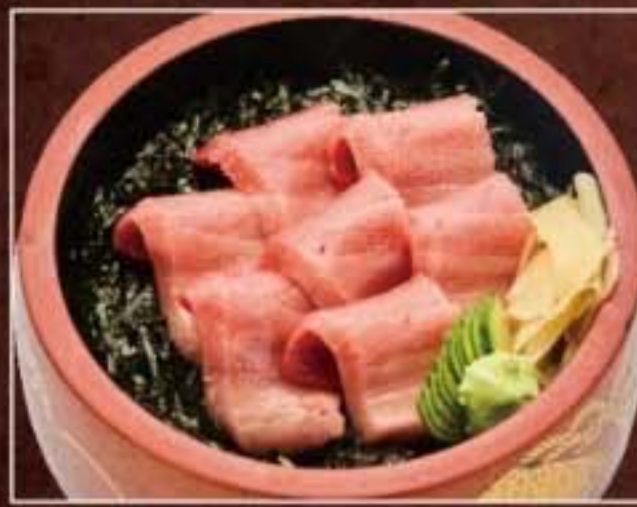
057 トロ鉄火丼 3,024円