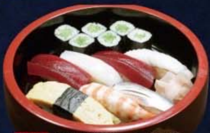
001 並にぎり 1,728円