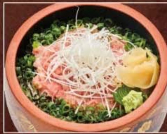
056 ネギトロ丼 2,376円