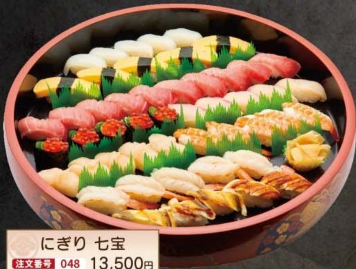
にぎり 七宝 注文番号 048 13,500円