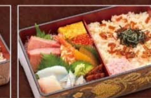
060 ちらし膳上 2,376円