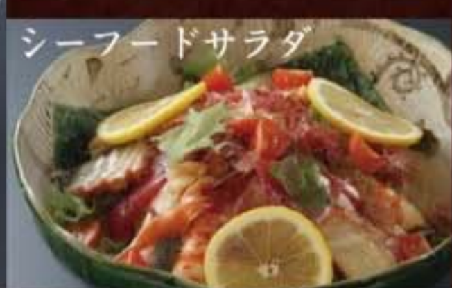
シーフードサラダ