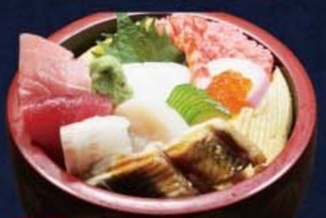
008 中ちらし 2,160円